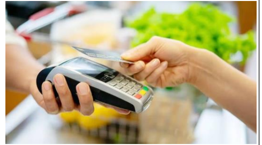
Paiement sans contact avec carte

Depuis 2016 , nous pouvons utiliser notre smartphone comme un mode de paiement sans contact ni code.