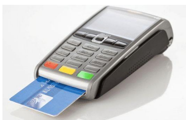
terminal de paiement

L'euro a été mis en circulation le 1 er janvier 2002