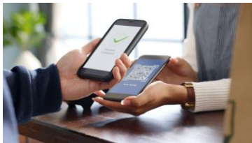
Paiement entre smartphones