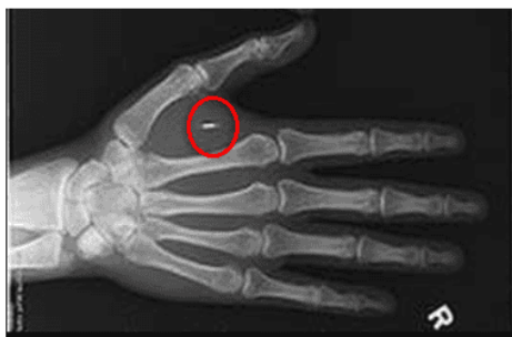
Puce d'identification sous la peau