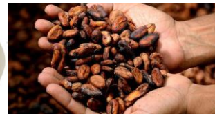
fèves de cacao