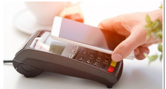
Paiement sans contact avec smartphone

C'est fou de se dire qu'on utilise encore tous les modes de paiement qui ont existé !