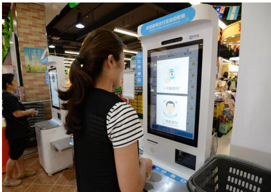
Paiement par reconnaissance faciale dans un supermarché en Chine.

C'est fou de se dire qu'on utilise encore tous les modes de paiement qui ont existé !