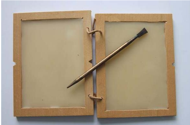
Tablette de cire reconstituée

Les Romains de l'Antiquité savaient écrire. Mais comme le papier n'existait pas, ils écrivaient sur le bois ou sur des tablettes de cire , à l'aide d' un stylet .