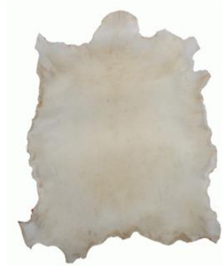
peau de chèvre

Un Chinois inventa le papier il y a presque 2000 ans. (en 105 après J.-C.) Il a fabriqué de la pâte en utilisant des lambeaux de tissu usé, de l'écorce d'arbre, des filets de pêche et de l'eau. Il a étalé cette pâte sur une pierre plate au soleil. C'était la première feuille de papier !