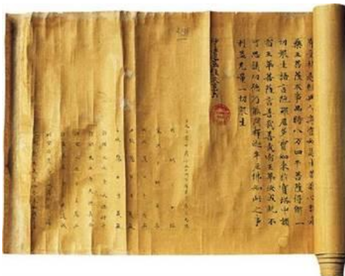
papier de mûrier (Chine, 150 après J.C.)

Le papier est apparu en Europe seulement au 11 ème siècle.