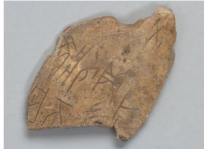
Homoplate de bœuf 12 ème siècle av. J.-C.