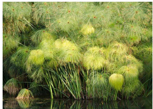
Le papyrus du Nil

Ils le fabriquaient avec un roseau qui poussait le long du Nil. Ils disposaient les lamelles dans un sens et dans l'autre. Il fallait ensuite le laisser sécher au soleil.