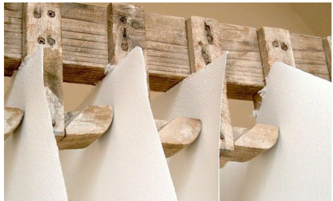
papier en lin et chanvre 12 ème siècle (Italie)