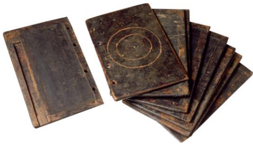
Cahier de Théodoros en bois