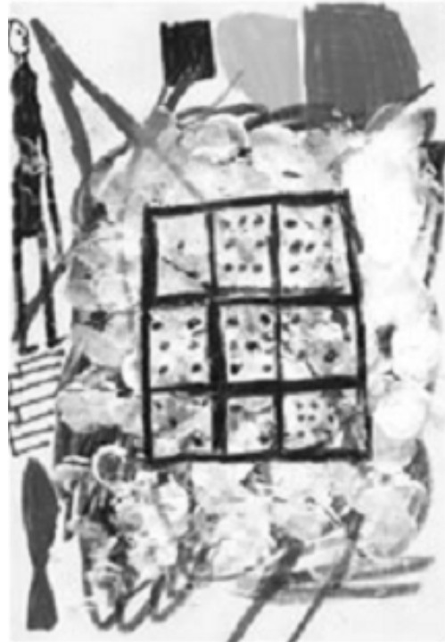
Gilbert Mazliah - Tentative de carré magique

b. On considère les neuf premières puissances de 2. Les disposer dans un carré multiplicativement magique.