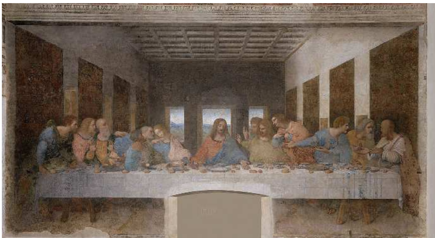
La Dernière Cène , Léonard de Vinci, 1494-1498

Rédige une synthèse de cinq-dix lignes : Jésus a-t-il institué le sacrement de l'eucharistie ? Que signifie l'eucharistie aujourd'hui ?