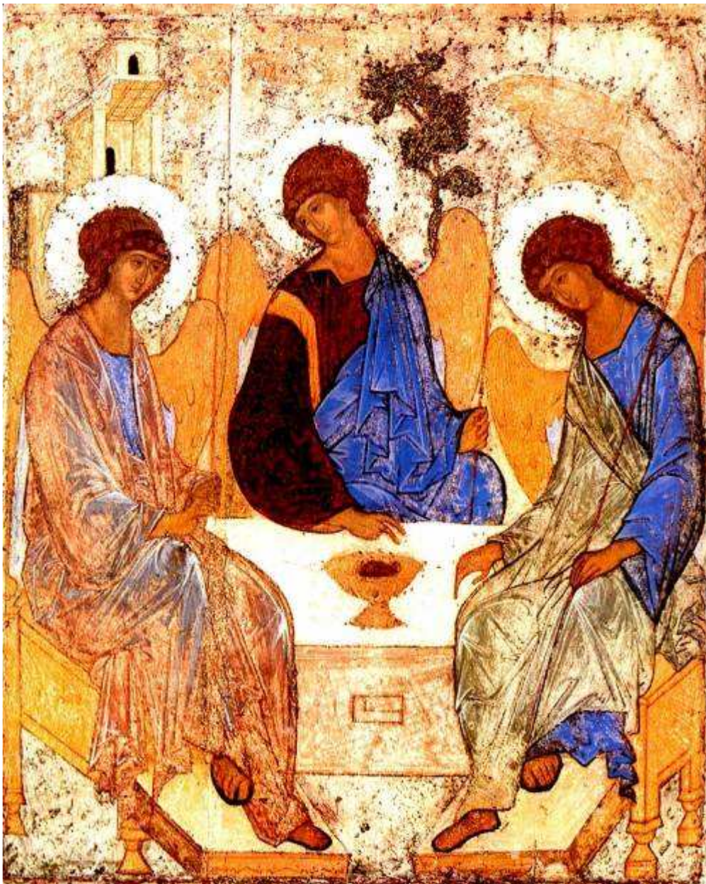
Les trois anges à Mambré (Sainte Trinité), 1410.

Andrei Roublev (Roubliov) ou Saint André l'Iconographe est un moine et peintre d'icônes russe né vers 1360-1370 et mort entre 1427 et 1430. Il a été canonisé récemment et sa fête est le 4 juillet. Il fut l'assistant du peintre Théophane le Grec et son œuvre perpétue la tradition byzantine, mais en introduisant plus de souplesse, de douceur.