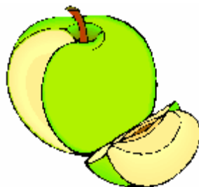
le quartier de pomme