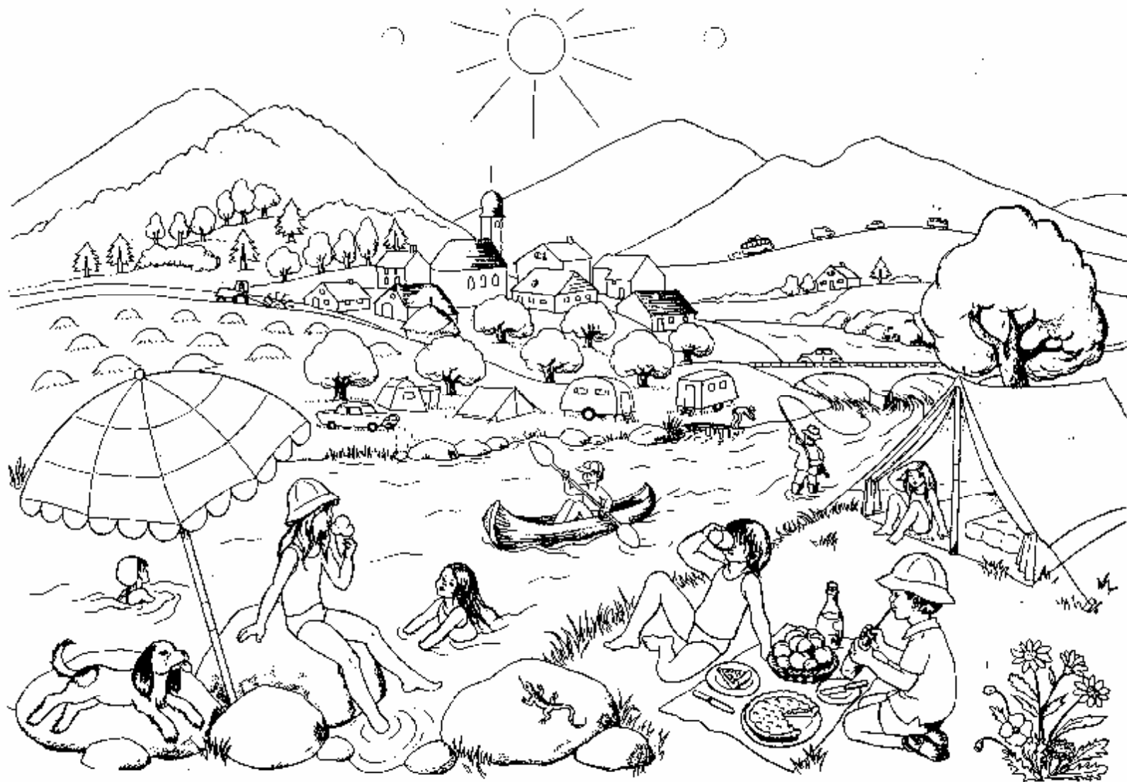
Repro-Fichier Ed. Degrid La montagne