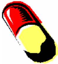
Gélules pour la gorge.