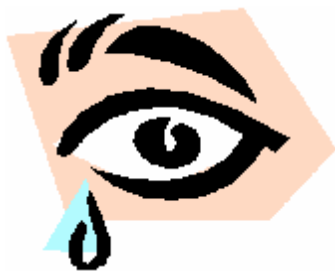
Gouttes pour les yeux