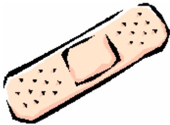
Sparadrap - pansement