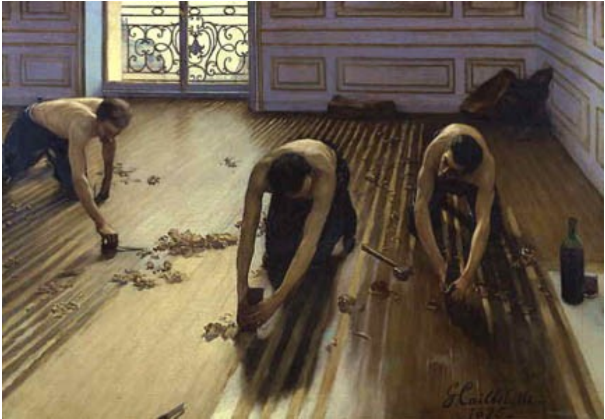
Gustave Caillebotte, Les raboteurs de parquet , huile sur toile, 1875, Musée d'Orsay (Paris).

Indication → Jamais des prolétaires (ouvriers) urbains n'avaient été peints. On peignait auparavant uniquement les paysans ou les riches particuliers. Caillebotte a peint les ouvriers qui travaillaient dans sa maison.