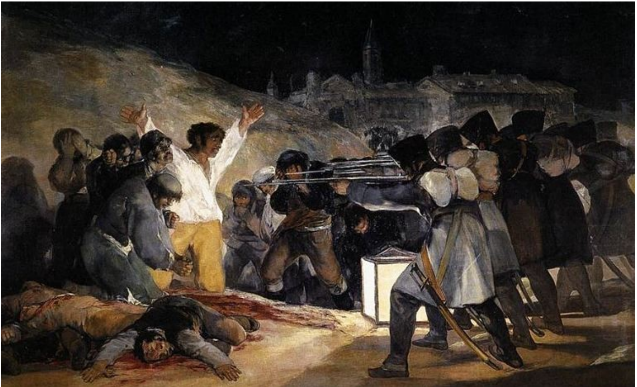
Francisco de Goya, 1814, huile sur toile, Musée du Prado (Madrid).