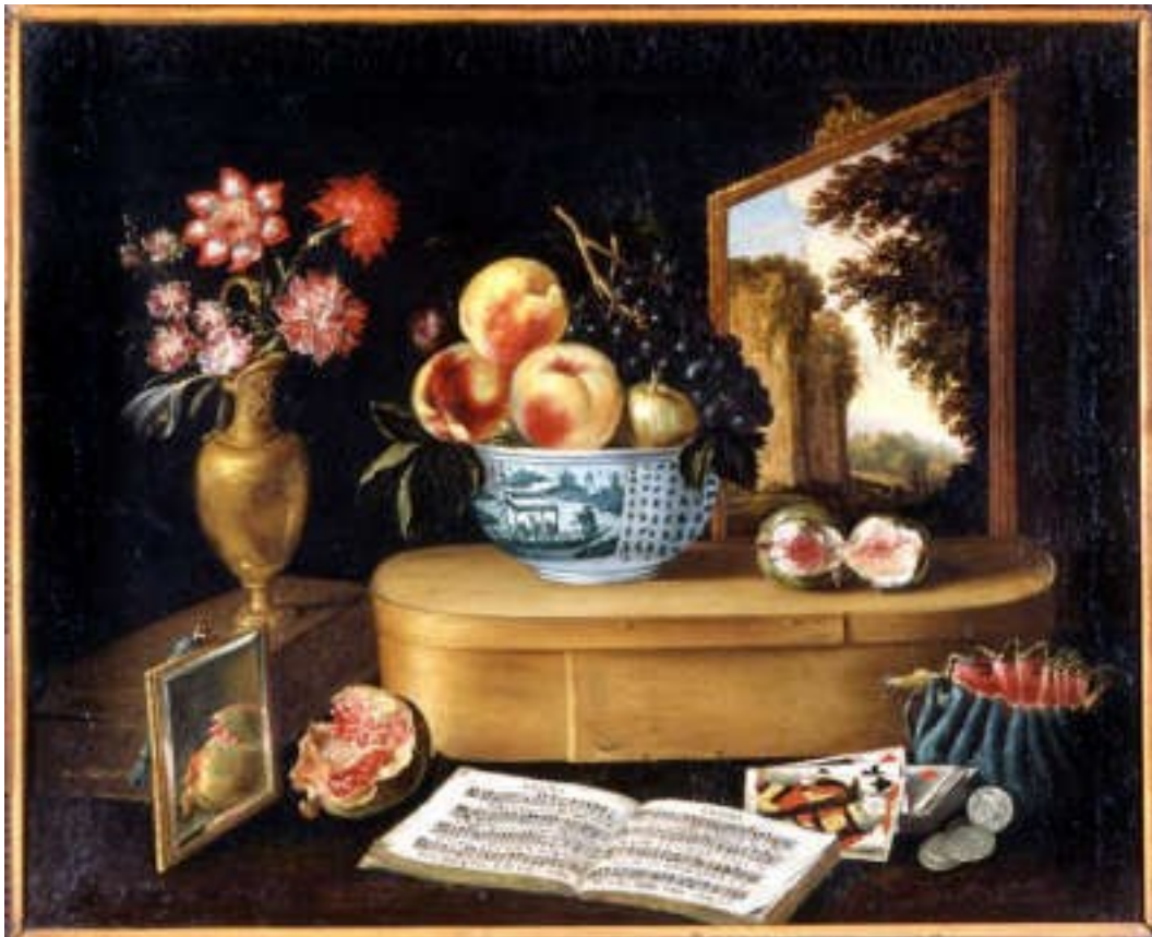
Les cinq sens, Jacques Linard, 1638, peinture sur toile, Musée de Strasbourg.