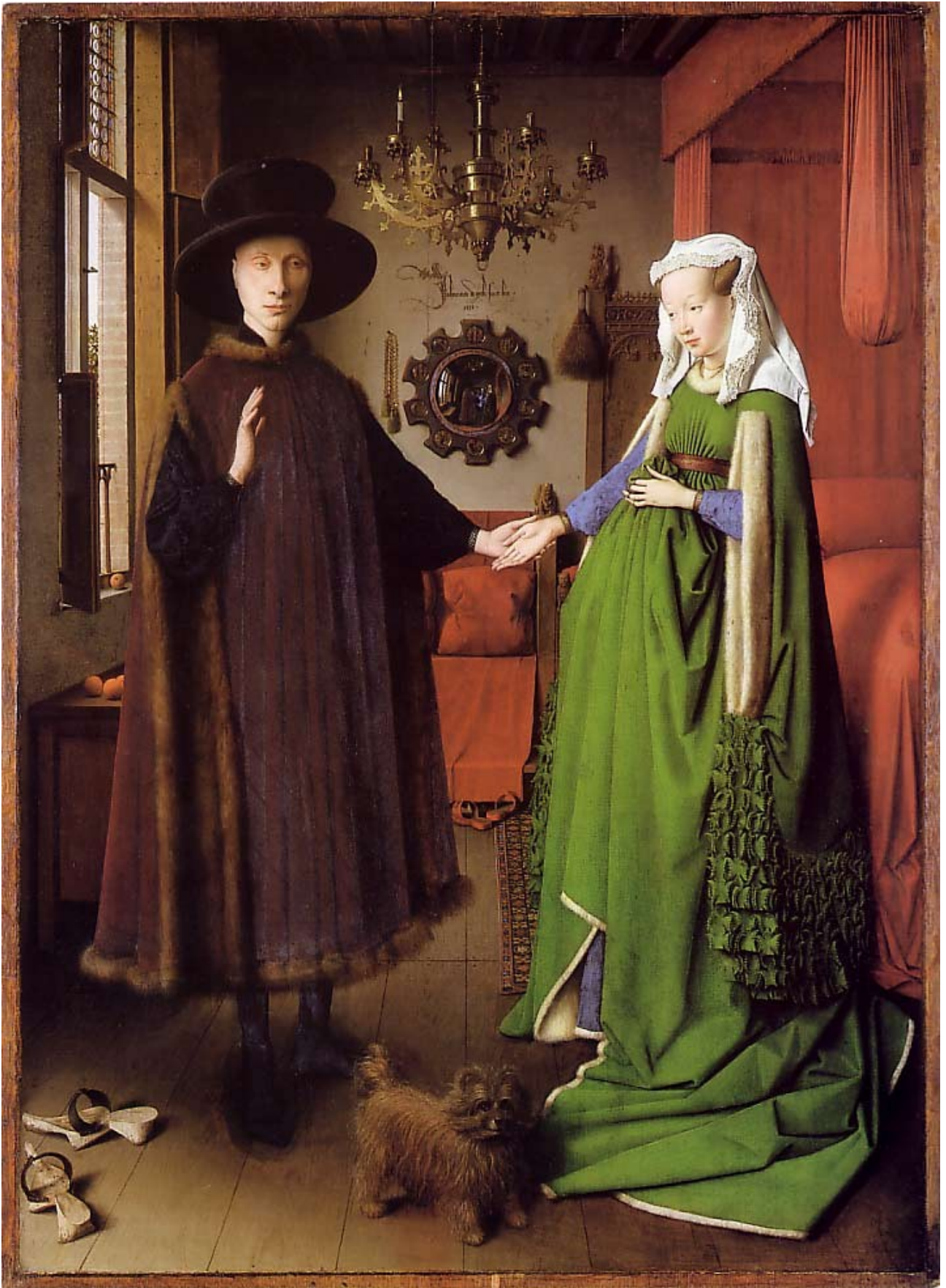
Les Époux Arnolfini, huile sur bois de Jan van Eyck, 1434.