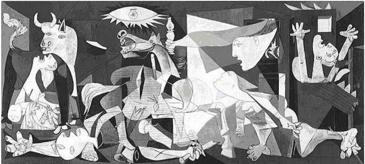
Guernica, Pablo Picasso, huile sur toile, 1937, Musée Reine Sofia (Madrid).

Indication → Jamais des prolétaires (ouvriers) urbains n'avaient été peints. On peignait auparavant uniquement les paysans ou les riches particuliers. Caillebotte a peint les ouvriers qui travaillaient dans sa maison.