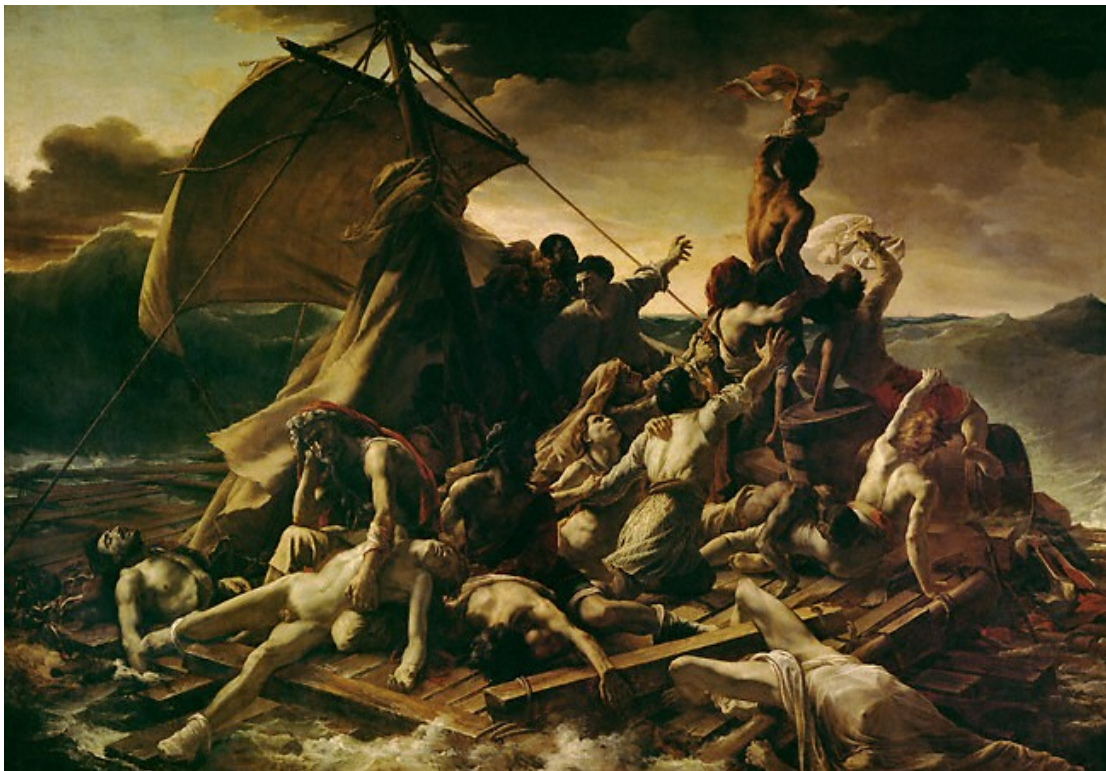
Le radeau de la Méduse, Théodore Géricault, 1818, huile sur toile, Musée du Louvre (Paris)