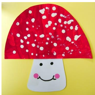
Technique du coton tige