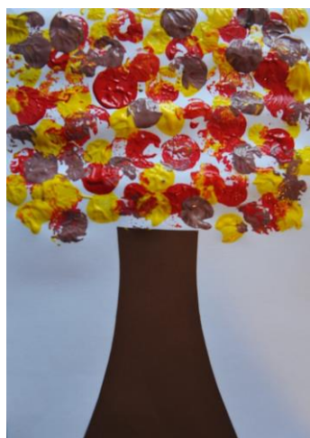
Technique du bouchon