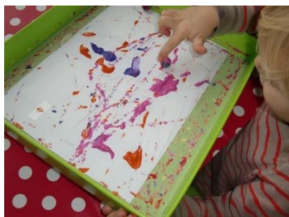
Technique de la bille