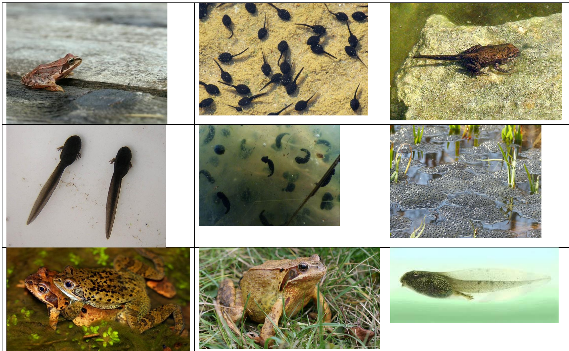
Photos à découper et à coller dans le tableau