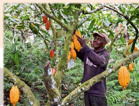
la récolte des cabosses