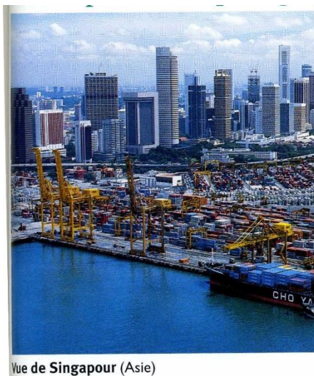
Vue de Singapour (Asie)